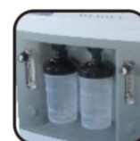
Humidificateur made in USA Pression 6PSI