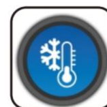
Technologie de refroidissement innovante permettant une durée de vie plus longue